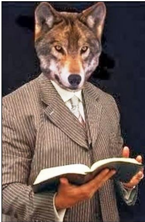
Les marchands du temple des temps modernes

SEMAINE DU 14 AU 20 MARS 4 ème DIMANCHE DE CARÊME Jean BONAVIDA - Jn 3,14-21