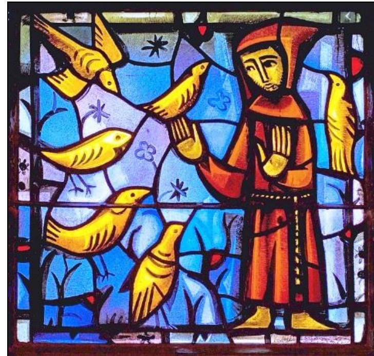
Vivre sa foi et bénir

Poursuivons la lecture du Psaume 66 : « Que Dieu nous prenne en grâce et nous bénisse, faisant luire sur nous sa face ».