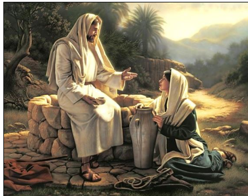
Guérison du cœur de la Samaritaine - Jn 4

« L'Esprit du Seigneur est sur Moi, parce qu'Il m'a consacré par l'Onction, pour porter la bonne nouvelle aux pauvres, Il m'a envoyé annoncer aux captifs la délivrance et aux aveugles le retour à la vue, renvoyer en liberté les opprimés, proclamer une année de grâce du Seigneur. »