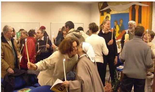
Baiser de paix au matin de Pâques

Nous manifestons l'unité de notre Famille en assurant un temps de prière mensuel vécu personnellement ou à plusieurs.