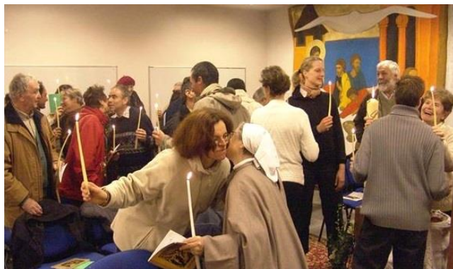
Baiser de paix au matin de Pâques

Nous manifestons l'unité de notre Famille en assurant un temps de prière mensuel vécu personnellement ou à plusieurs.