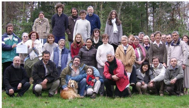
Lors d'une rencontre

Nous vivons dans le monde et nous nous engageons à faire de la Sainte Trinité le mystère central de notre foi et de notre vie chrétienne. L'Évêque de Pamiers (Ariège), est notre Evêque protecteur depuis 1994.