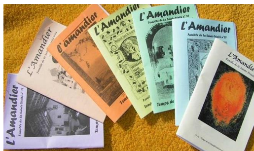
La revue de la Famille

Tous les deux mois, membres et amis reçoivent l'Amandier, la revue de la Famille à laquelle ils collaborent, qui nourrit leur vie spirituelle et leur donne des nouvelles.